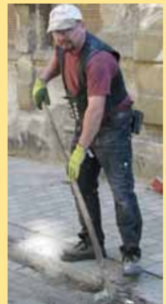
Nicht gucken - Mitmachen!