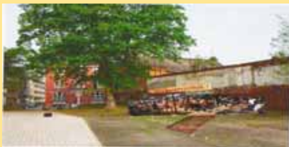
So könnte eine Terrasse eines Cafés evtl. aussehen.

Für das Quartier wäre das Ganze sicherlich ein Gewinn, da der schöne alte Baumbestand