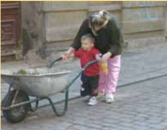
Früh übt sich...

In der letzten Quartierszeitung hatte das Quartiersmanagement zum großen Saubermachen in Buckauer Quartieren mit dem Termin zum 30.04.2011 aufgerufen. Leider wurde dann der Termin für Buckau von der GWA schon vorhergelegt, so dass letztendlich die Aktion im Klosterbergecarreé etwas losgelöst von den anderen Buckauer Aktivitäten stattfinden musste. Doch trotzdem wurde eine Menge geschafft!