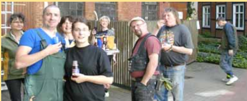
Nach getaner Arbeit - Die fleißigen Helfer beim Grillen.

Beim anschließenden Grillen auf dem Hof des Quartiersladens war man sich einig: Wenn die Eigentümer der bisher ungenutzten Flächen und der leer stehenden Gebäude ihre Pflichten nach Straßenreinigungsordnung ordentlich wahrnehmen würden, würde es um Ordnung und Sauberkeit im Klosterbergecarreé wesentlich besser stehen!