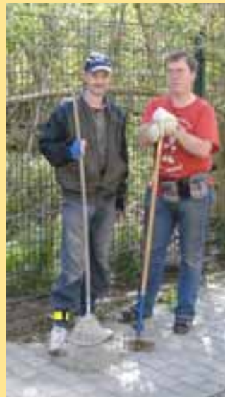
Eine starke Truppe.