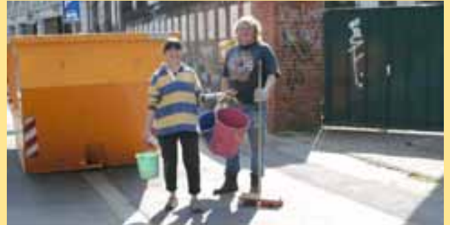
Alles für Magdeburg!

Und weil der Container riesig war, fanden sich auch einige ganz Beherzte, die es wagten, einen Anfang bei der Beräumung des Einganges der ehemaligen Villa der Porzellanfabrik zu starten.