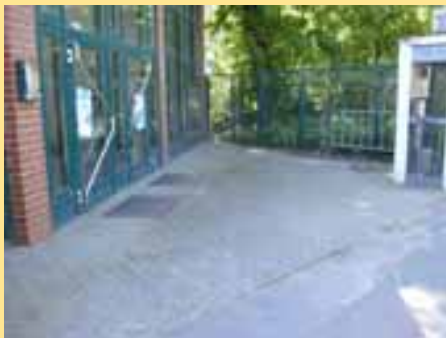
Die Sporthalle strahlt wieder.

Hauptsächlich wurde vor den leer stehenden Gebäuden sauber gemacht, um die sich sonst keiner kümmert. Auch vor der Buckauer Sporthalle (Liegenschaftsservice der LH Magdeburg) wurde gereinigt.